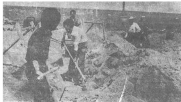
驻东营的惠民地区建筑公司第三工程处的职工坚守岗位，以实际行动维护正常的生产秩序和安定团结的政治局面。图为部分干部在施工现场劳动，以确保任务的完成。